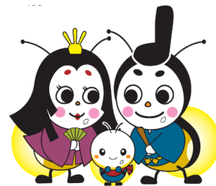
「姫ママル」「ホタルン」「源氏パンパル」