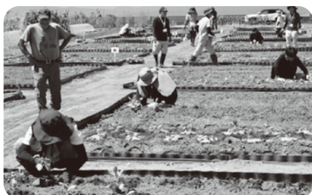
▲9月 野菜の定植の様子

8月から翌年1月までの半年間、農作物の作付けから販売までを実習と座学で連続的に学ぶ実践形式で行い、塾生の皆さんは一つ一つの講座に真剣に取り組み、前向きな姿勢で学びを深めていただきました。