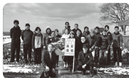
▲1月 農業塾修了式後の集合写真

市ではこの成果をふまえ、来年度の第4期開講に向けて引き続き地域農業の新たな担い手育成を推進してまいります。