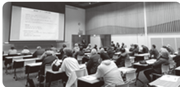
▲スマート農業勉強会（第1部）の様子

マニュアル化することができ、短期間で技術習得が可能となることで新規就農者の壁が低くなり、新規参入がしやすくなる、ひいては農地を守ることにつながるとお話しいただきました。