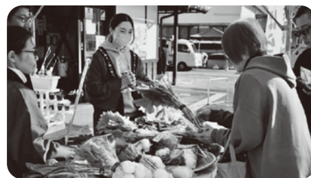
▲11月 販売実習の様子

野菜が多数のお客様に好評を博し、収穫した野菜が売れた喜びと販売の難しさを体験いただく貴重な機会となりました。