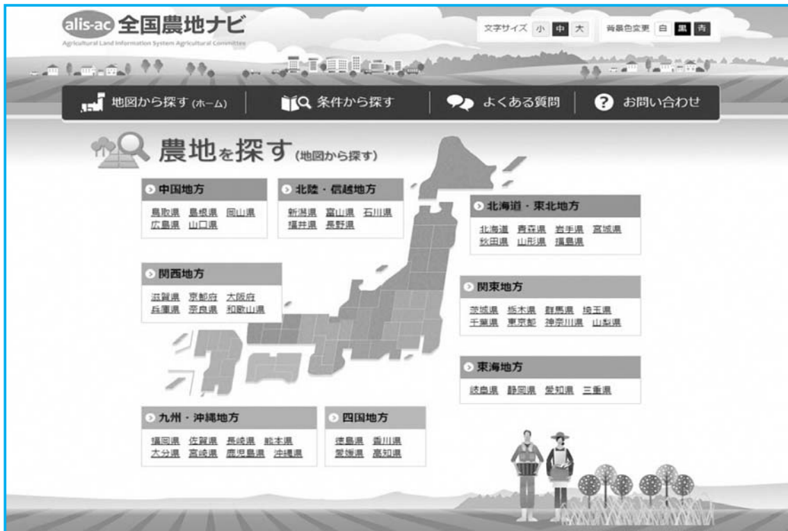
全国農業会議所 農地ナビ https://www.alis-ac.jp/

平成26年に施行された改正農地法に基づき、平成27年4月よりインターネット上で農地情報を確認することができる農地ナビが設置されました。この農地ナビは、全国の農地に関する情報を広く公開することで、認定農業者等の担い手の経営規模の拡大や農業への新規参入等を希望する方々に農地情報を提供し、農地利用の促進や集積・集約化を進めることを目的としています。農業委員会が作成している農地台帳の項目のうち、改正農地法で公表することと定められた項目と農地の地図情報を合わせてインターネット上で公表しています。