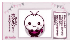
▲放送画面イメージ