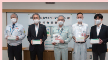
▲災害時の避難所等に配備します