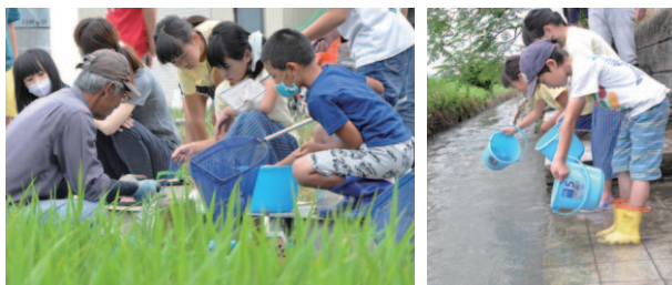
(左)約1.5cmに育ったコブナを網ですくいます (右)獲ったコブナを「大きく育てね」と川へ放流

地域の子どもたちが自然豊かな農地に親しめるようにと、約1カ月かけてゆりかご水田で育てられたコブナを捕獲し、近くの川に放流しました。