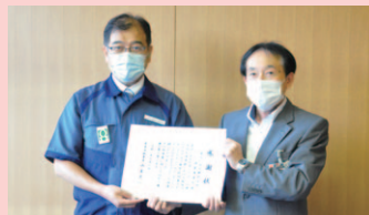
▲教育長から感謝状を贈呈

三菱ケミカル(株)から市内各小中学校の感染症対策としてフェイスシールド2,800枚とアンチウイルススプレー45本を寄贈いただきました。