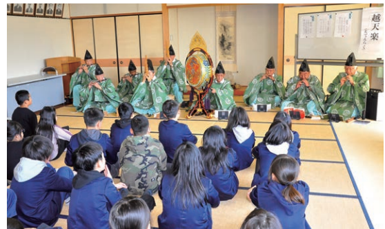
演奏は宇賀野の「紫雲社」のみなさん。坂田神明宮での式典のほか、5月の鍋冠祭でも演奏を披露されています。

伊吹小学校5、6年生29人が、雅楽の演奏を鑑賞し、歴史や楽器について学ぶなど、日本の伝統音楽に触れました。