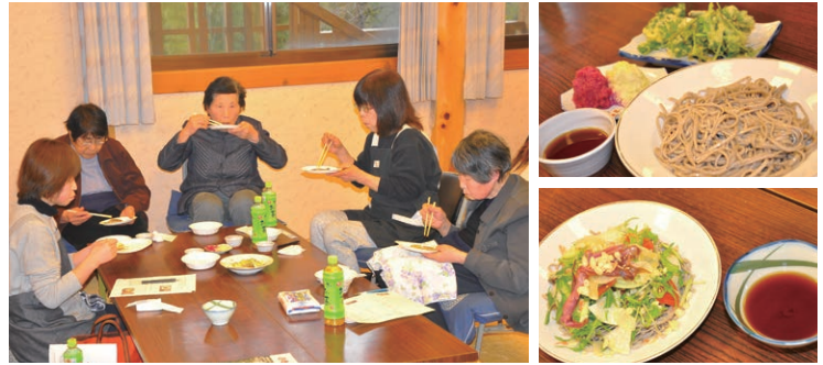
薬味に赤カブと伊吹大根のおろしを添えた「伊吹おろしそば」(右上)と、伊吹大根やミョウガの漬け物などを乗せた「ぶっかけサラダそば」(右下)

参加者からは「こんな食べ方があったとは」と驚きの声上がり、地元の食材を存分に味わいました。