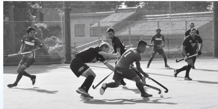
昨年7月8・9日に県立伊吹運動場で開催された日本代表とニュージーランド代表のテストマッチの様子

今回、ホッケーの概要やルールについて紹介します。「ホッケーのまち まいばら」として、みなさんもぜひ会場にお越しいただき、ホッケー観戦を楽しんでみてください。