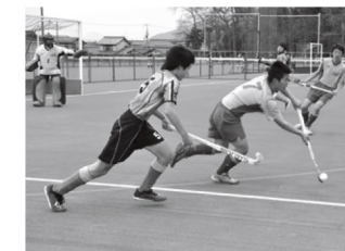
伊吹第1グラウンド竣工式でのオープニングゲームの様子

日時 8月16日(金)～19日(月)※競技は17日(土)から 会場 県立伊吹運動場、伊吹第1グラウンド 種目 6人制ホッケー