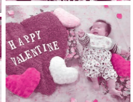
◀お母さんの声掛けに笑顔で応えます