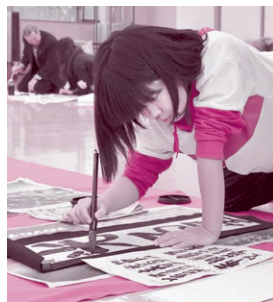
何度も書き直し、どんどん上手くなりました