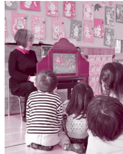
毎月1度の、園児たちの楽しみです

お話サークル「ぽけっと」による絵本や紙芝居の読み聞かせ会。園児たちは夢中になって聞き入っていました。