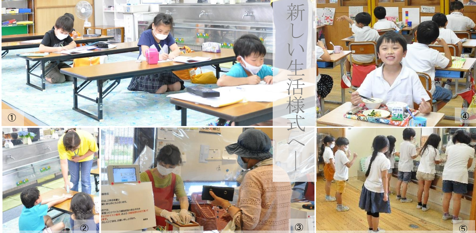
①② Estudando no clube para crianças depois da escola e esterilizando às mãos antes do lanche (clube Ibukikko), ③ Um plástico utilizado no caixa como prevenção e o uso de luvas para atender os fregueses (Michi no eki e Ohmi haha no sato), ④⑤ Na hora da merenda, evitam o contato presencial. Lavam as mãos em intervalos e esperam a vez, mantendo uma certa distância (Kanan Shogakko)