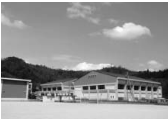
完成した双葉総合体育館

体育館の予約等は、双葉総合体育館(近江スポーツクラブ) TEL 52-0858までお願いします。