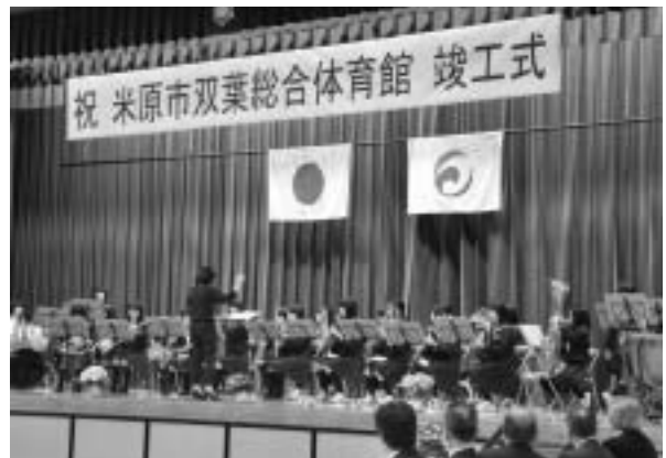
竣工式(双葉中学校吹奏楽部演奏)の様子