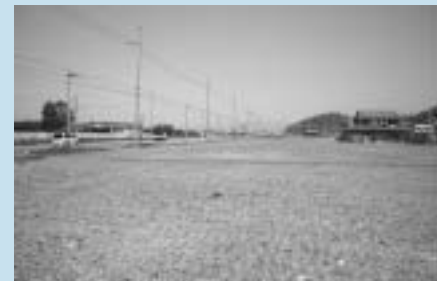
《物件の一例のNo.11~18付近》

※上記物件以外にも随時販売（貸付）している物件がありますので、詳しくは、市公式ウェブサイトをご覧ください。詳しくは、都市振興課までお問い合わせください。