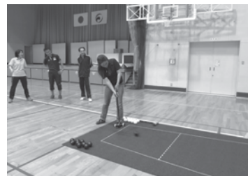
▲ニュースポーツ「囲碁ボール」