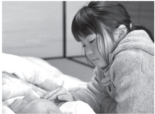
出典:『いのちつぐ「みどりびと」』(農文協、現8巻)の第1巻 「恋ちゃんはじめでの看取り」より