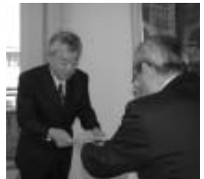
委嘱状交付の様子 (4月1日米原庁舎)

委員の仕事は、市職員の勤務条件に係る措置の要求に関する事、不利益な処分についての不服申立ての処理、職員の苦情処理などで、任期は4年です。