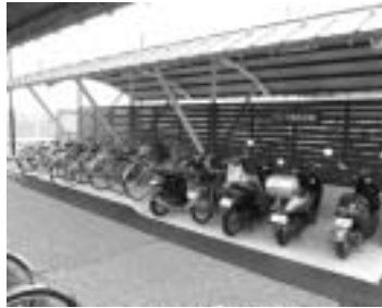
「思いやり駐輪」でみんなが気持ちよく

駐輪場内では自転車の整理整頓を心がけ、他の利用者を思いやり、マナーを守って駐輪しましょう。