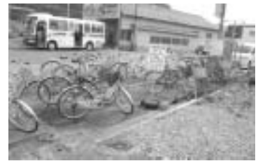
身勝手な駐輪は景観の乱れに

身勝手な駐輪は、歩行者の通行の妨げやまちの景観の乱れにもつながるほか、盗難の恐れもあります。マナーを守って決められた場所に駐輪しましょう。