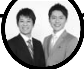
【MC】吉本芸人「ファミリーレストラン」