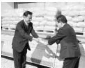
支援米贈呈式の様子(相馬市にて)

福島県相馬市の一日も早い復興を願って実施した「相馬市へ新米を贈ろう!」事業で、市民のみなさんからご協力いただいた支援米を11月8日(金)に相馬市へお届けしました。