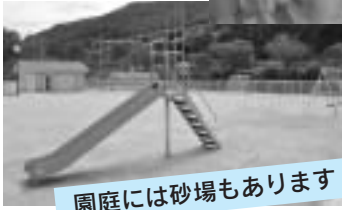
園庭には砂場もあります