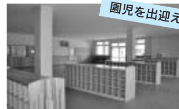
園児を出迎える昇降口