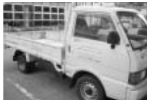
廃食用油の回収に使用する車は、 BDFを使用しています。