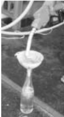
漏斗を使うと容器に いれやすくなります。