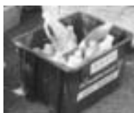
廃食用油 回収ボックス