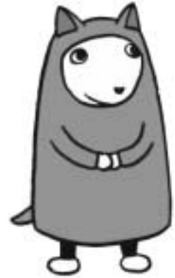
介護相談員キャラクター クーちゃん

介護相談員は、こうした利用者の不安や不満が大きなトラブルにならないよう、サービス提供の場を訪問して利用者の話を聴き、事業者や行政に橋渡しをする役割を担っています。利用者のプライバシーや秘密は守られますので、安心してご相談ください。