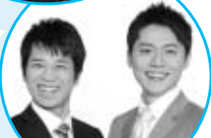
滋賀県住みます芸人 ファミリーレストラン