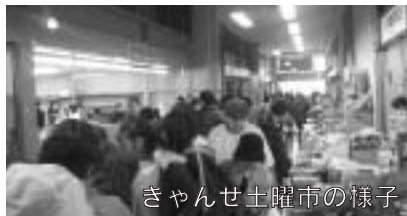
きゃんせ土曜日の様子