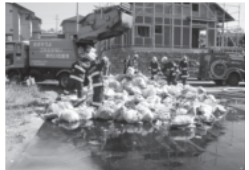
▲市内で発生したごみ収集車の火災現場

11月8日、市内でごみ収集車の火災事故が発生しました。ガス抜きをしていないカセットボンベやスプレー缶が混入していたことが火災の原因です。