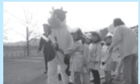
▲山東幼稚園で行われた防火ふれあい広場