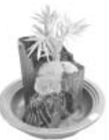
「炭盆栽」 醒井水の宿駅 で販売中