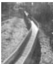
ドラゴンズライダー