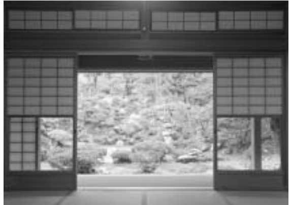
写真右 浅井3姉妹の次女「初」の夫、京極高次の墓 京極家祖先の集まっているこの墓所は国指定史跡 写真左 今にも飛び出しそうな幽霊の絵画 写真下 徳源院の広間から庭園を望む