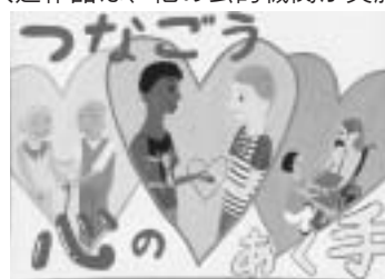
昨年の最優秀作品(人権ポスター小学生の部) ▲