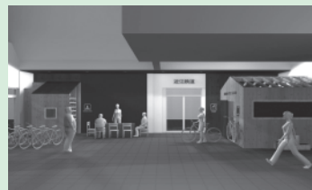
米原駅サイクルステーション イメージ図

●自然観光促進事業 …… 335万円 官民連携による広域自然観光ルートの整備を推進します。