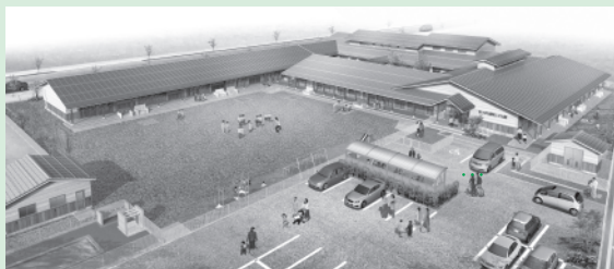
(仮称)まいばら認定こども園完成予想図