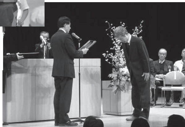
▲ 昨年のスポーツ顕彰表彰式の様子