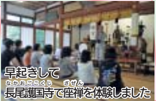
早起きして 長尾護国寺で坐禅を体験しました

今日のミッションは… 『今年のもの作り体験イベント “ふれあいの里フェスティ バル”の準備を始めよう!』