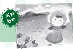
絵本「まいバラちゃんの旅」