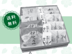
四季のお菓子詰め合わせ