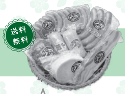
伊吹ハムセット各種