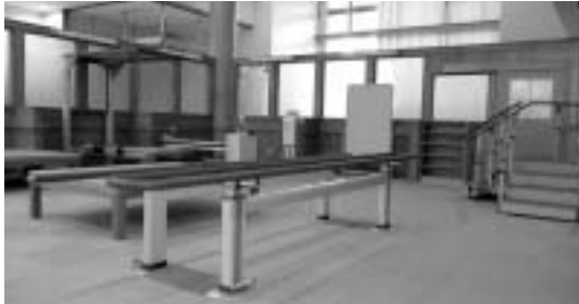
個別リハビリの実施に向け、リハビリスペースや必要な機器の整備を行いました。

今回の改修工事は、個別リハビリの実施などにより、在宅ケアの充実を推進するための第一歩として進めてきたもので、市の医療福祉への取り組みの一つとなるものです。