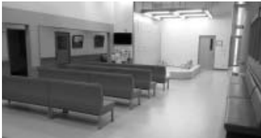
施設全体の面積は、221m 2 から1082m 2 へ拡大。待合室もゆとりのあるスペースを確保しました。