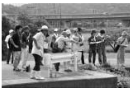
▲今後、倶楽部のみなさんには、ピワマスまちづくりの「仕掛け人」としてご活躍いただきます。

して活動することになった。この日は天野川沿いを歩き、ピワマスの遡上の妨げとなっている堰堤や、アユなどの遡上状況などを確認したほか、醒井養鱒場でピワマスの生態や養殖技術などについて学習しました。