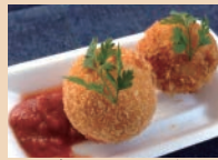
びわサーモンと クリームチーズのコロケ