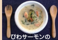
びわサーモンの クリームスープ