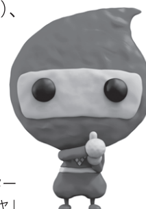
臨時福祉給付金キャラクター 「カクニンジャ」