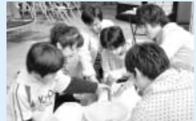
▲石臼でコーヒー豆を挽く様子