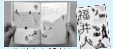
▲ガイドブック「福井人」

まちづくりに関わる人、関わりたい人が集まり、それぞれの活動紹介や参加者同士の交流ができます。ぜひご参加ください! 日時▶2月15日(土)13時～16時30分 会場▶ルッチプラザ(長岡1050-1) 内容▼ ・講演会 福井の人々との出会いを楽しむ旅のガイドブック「福井人」の制作委員会の方々からお話を伺います。 ・活動団体の取り組み紹介、みんなで米原のいいところを探るマップづくり、好評の石臼コーヒーなど