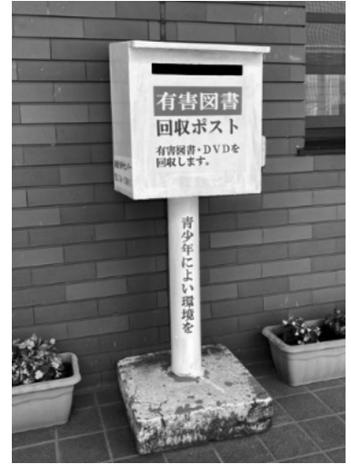
坂田駅前の白ポスト

※なお、有害図書の回収ポストですので、通常の雑誌や新聞は回収ポストに入れないでください。