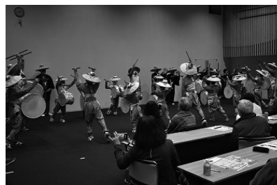
写真2 伊吹山奉納太鼓踊りの披露

には、令和5年10月に8年ぶりに実施された「伊吹山奉納太鼓踊り」を保存会の協力で特別に披露していただき、34人の踊り手による息の合った太鼓踊りは、参加者の皆さんを魅了しました。