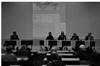
写真3 認定記念シンポジウム風景

この中で、社会情勢の変化や地域の人口が減るなか、民俗行事をつないでいくために、祭礼日の変更や、内容の簡素化など、これまでの取り組みや、民俗文化財の保存会同士の情報交換の実施などの提案もあり、これからの文化財の保存と活用を考えるうえでも、参考となる意見をいただきました。（生涯学習課）