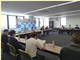
第2回常任委員会の様子