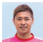
村田 かずや 元Jリーガー