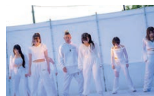
Diversityさん (湖北を代表する中高生ダンサー)