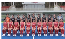
コカ・コーラレッドスパークスさん (ホッケー国内トップチーム)