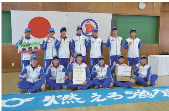
※昨年行われた「いちご一会とちぎ国体」で優勝を収めた、少年男子。大半が米原市出身の選手で構成されている。

※米原市で開催される競技及びデモンストレーションスポーツの会場と開催期間。ホッケー競技は、成年男子・女子、少年男子・女子の全種別が行われます。