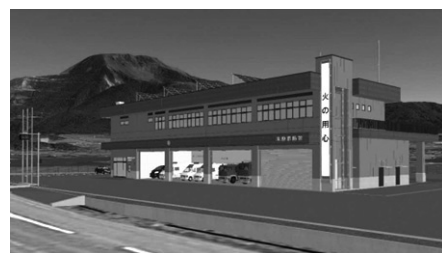
▲(仮称)米原消防署の完成予想図