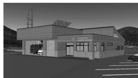
▲(仮称)米原出張所の完成予想図