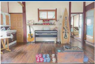
体験型宿泊施設 「ライダーズハウスいびぎ」