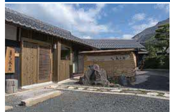
石挽き製麺工房 「伊吹長兵衛」