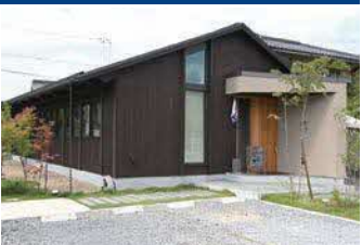
和食料理店 「結咲家」