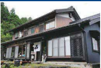
ゲストハウス 「うむ」