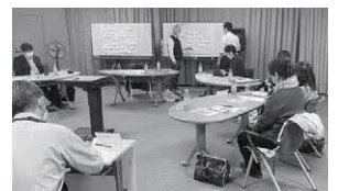
社会教育委員会議