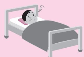
体調不良時は来場を控える