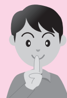
大声で会話をしない