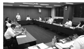
6月23日(水)第1回目の会議を行い、任期2年の間に取り組むテーマなどを話し合いました。