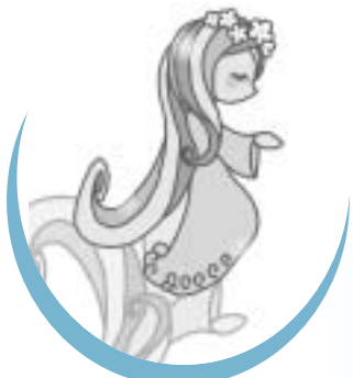
まいばらの水 イメージキャラクター スイナちゃん

お問い合わせ 経済環境部 環境保全課 (伊吹庁舎) ☎58-2230 FAX 58-1630