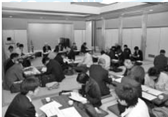
地区担当ごとに顔合わせをし、今後の課題整理の方法などについて話し合いました。

過疎・高齢化する集落への目配りや住民の声の幅広い吸い上げ、行政と集落の仲立ちとしての役割などを担っていただきます。