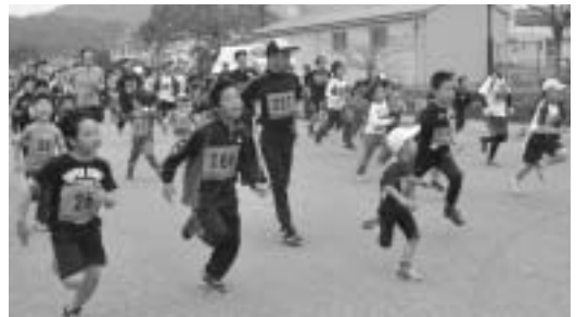
▲第2回入江干拓マラソンの様子