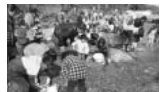
▲過去の放流の様子