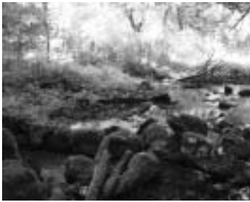
▲ 山麓一帯に湧き出る水

お問い合わせ 経済環境部 環境保全課 (伊吹庁舎) ☎58-2230 ☎58-1630