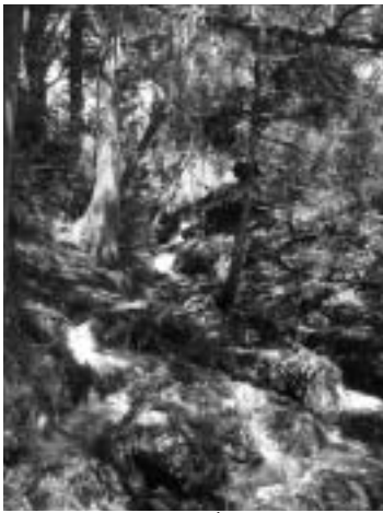
▲ 湧き出した水が大きな流れに