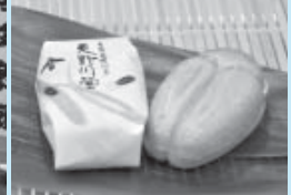
蛍の形をした「天野川」