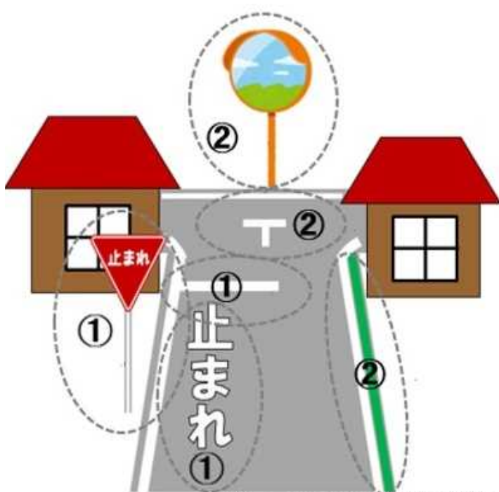
※イメージ図のため実際とは異なります。