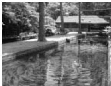
▲滋賀県醒井養鱒場

殖に成功しましたが、この高成長系品種の養殖ビワマスも、天然ビワマスと同様に、成長すると成熟して卵に栄養がまわり、産卵後は死んでしまっていました。 そこで、醒井養鱒場では、成熟せずに良好な肉質のまま成長する、新たな養殖ビワマス(全雌三倍体ビワマス)の研究に取り組み、平成24年8月にその養殖化に成功しました。 このことにより、一年を通じて美味しいビワマスの養殖が可能となり、今後は市場に出回ることが期待されています。