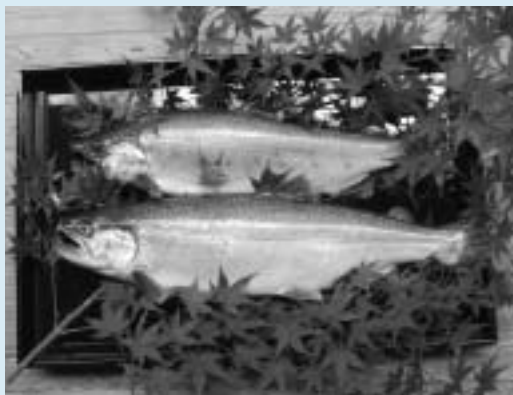
▲養殖ビワマス