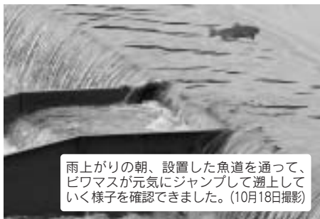
雨上がりの朝、設置した魚道を通して、ピワマスが元気にジャンプして遡上していく様子を確認できました。(10月18日撮影)

天野川ピワマス遡上プロジェクトでは、琵琶湖から天野川を遡上するピワマスが、5年以内に丹生川との合流点まで遡上できることをめざして活動しています。 今回は、ピワマスたちの遡上を妨げている第一関門、岩脇地先にある高さ70cmの堰堤に簡易魚道を設置する作業を行いました。