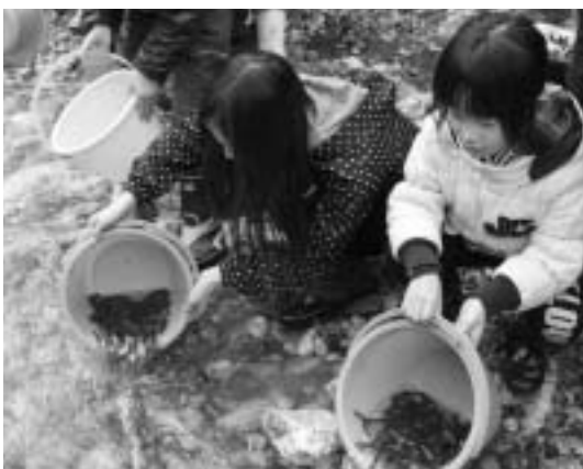
▲昨年の放流イベントの様子

●その他 小雨の場合は決行します。ただし、河川が増水し稚魚を放流できない場合は中止します。当日の朝7時以降に環境保全課までお問い合わせください。